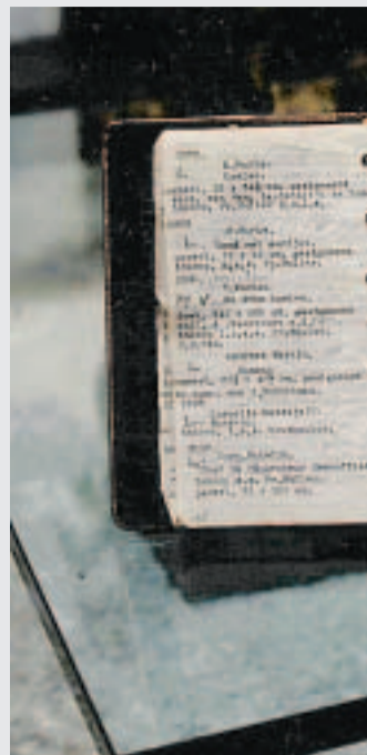
OPPSPORINGENS KUNST. Jakten på et forsvunnet kunstverk begynner gjerne med et kornete fotografi av maleriet på veggen bak en gammel bestemor. Eller med en salgskatalog, som denne fra galleriet til Jacques Goudstikker.