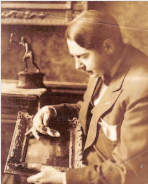
DØDE PÅ FLUKT FRA NAZISTENE. Jacques Goudstikker var en av verdens største samlere da nazistene invaderte Amsterdam i mai 1940 og hans utsvevende liv kollapset.